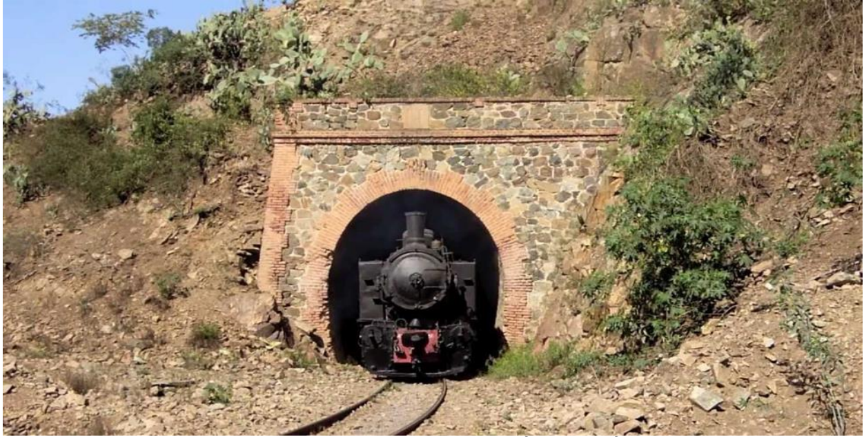
ንተዓዛቢኡ ዘደንጹ ገለርያ። ኣብ መስመር ኣስመራ ባጽዕ ብዙሓት ገለርያታት ኣለዉ።