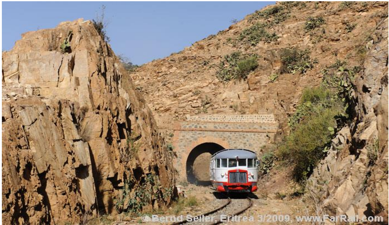
© Bernd Seiler, Eritrea 3/2009, www.FarRail.com