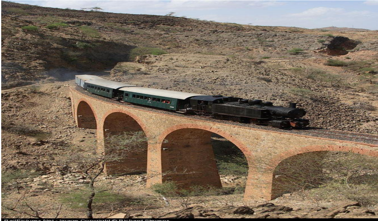
ብዘበን ጥልያን ዝተሰርሑ ቢንቶ ክሳብ ህጂ ብጥዕዩ ምህላዉ ንክንደይ በጻህቲ ዘገረመ ኣዩ።