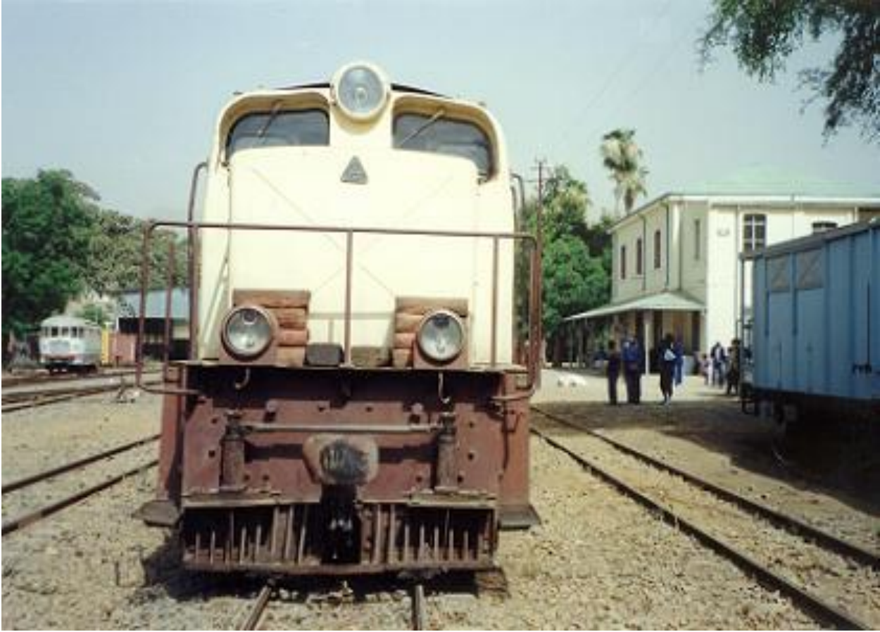
ባቡር ጸዕዳ እቲ ድሒሩ ዝኣተዎ።