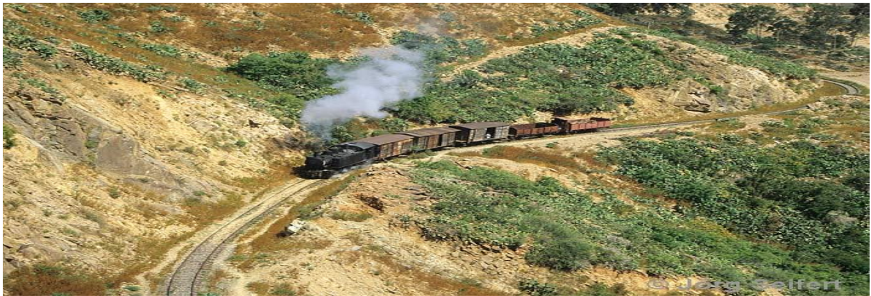
ዋላውን እቲ ጎቦታት ንመልክዕ ኤርትራ ንምጽባቕ ኢሉ ዝተፈጥረ ኣዩ።