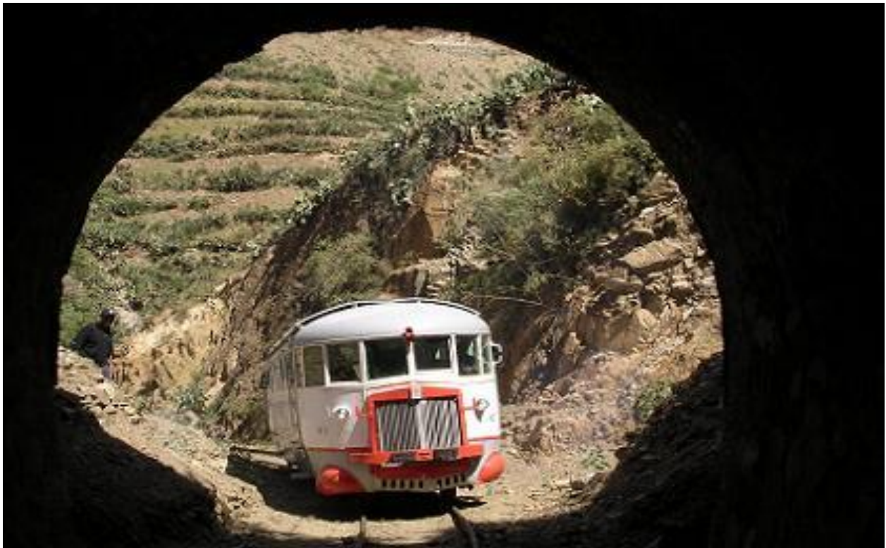
ሎተሪና ኣብ ገለጺ ክትኣቱ ክላ።