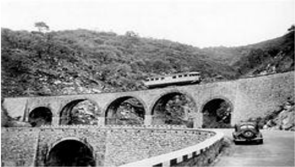
መንገዲ ባቡርን ጽርግያ ማኪናን ።

ህዝቢ ኤርትራ መሬትይ ባዕላይ ክብል ከሎ ብጀካ እቲ ባህርያዊ ተፈጥሮን ቅርጻ መሬትን ተደኩናትሉ ዘላ ኣገዳሲ ዘባን፡ እዚ ጥንታውን ሰሓብን ኣብ ግዜ ጥልያን ዝተሰርሑ ጽርግያን መንገዲ ባቡርን ዓቢ ኣቋልቦ ዝሰሕብ ካብቲ ሓደ ንጸላእትና ድቃስ ዝኸልአም ዘሎ እዩ። እዚ ዝሓለፈ 26 ዓመታት ሰላም ረኺብና እንተነነብር፡ ሎሞ እዚ ንርእዮ ዘሎና ኣደናቂ ነገራት ብጉቡእ ሰሪሑ ብዙሓት ደቂ ሃገርን ወጻእተኛታት ገያሽ (tourists) ኣኣንጊዱ ንመንእሰያትና ናይ ስራሕ ዕድል ከፊቱ ዓቢ ምንጪ እቶት ምኽነ ኔሩ።